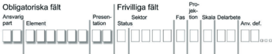
(Figur: Exemple på CAD-lagernamnets uppbyggnad)

Lagernamnet ska delas in i ett antal fält som i sin tur består av ett bestämt antal tecken. Lagerstandardens anger att de tre första fälten är obligatoriska och de övriga fälten är frivilliga.